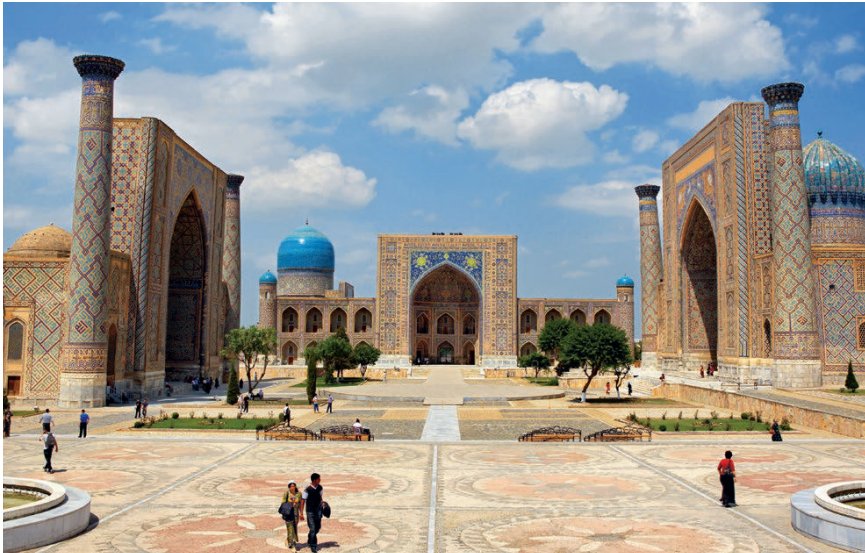
Registan Ensemble, Samarkand

z. B. 10-tägige Privatreise zu den schönsten Orten Usbekistans