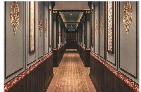
Flur auf dem Hauptdeck