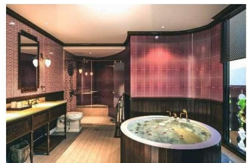
Exklusives Badezimmer mit Whirlpool