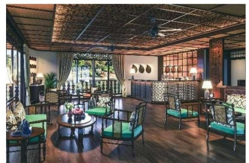
Café- und Bar-Lounge auf dem Hauptdeck