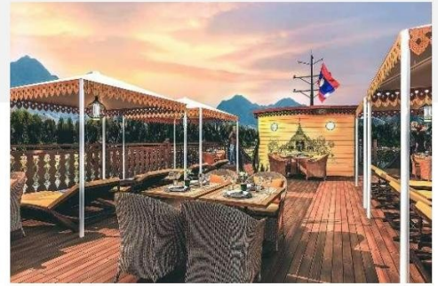
Sonnenterrasse für entspannte Ausblicke