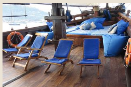
Entspannen an Bord