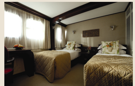
Kabine mit Twin-Betten