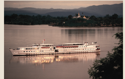
Kreuzfahrtschiff Belmond Road to Mandalay