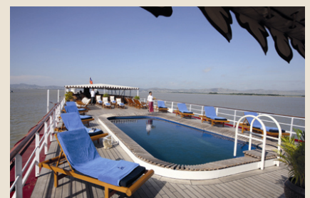
Sonnenterrasse mit Pool