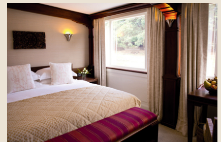
Kabine mit Doppelbett