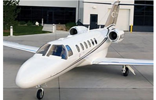
Cessna Citation CJ2

Der Cessna Citation Jet ist ein zweistrahliges Flugzeug des amerikanischen Flugzeugherstellers Cessna. Er bildet die Grundlage für diverse, weiterentwickelte Modellvarianten wie z.B. dem CJ2 und CJ3. Der Cessna Citation Jet 2 gehört aufgrund seiner Größe zur sogenannten Light Jet Kategorie. Er wurde im Jahr 2000 zum ersten Mal ausgeliefert und besitzt eine sechssitzige Kabine.