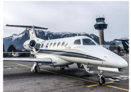
Embraer Phenom 300

Bei der Phenom 300 handelt es sich um einen Jet des brasilianischen Herstellers Embraer. Er gehört zur Super Light Jet Kategorie, ist der Spitzenreiter seiner Klasse und berühmt für seine Schnelligkeit. So kann das Flugzeug die Strecke von Düsseldorf nach Palma de Mallorca in unter zwei Stunden zurücklegen. Die Erstzulassung der Phenom 300 erfolgte am 03. Dezember 2009.