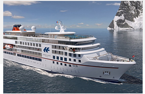
Kreuzfahrtschiff HANSEATIC inspiration