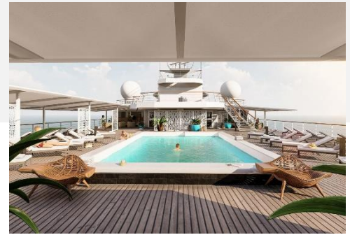
Schwimmbad auf dem Sonnendeck