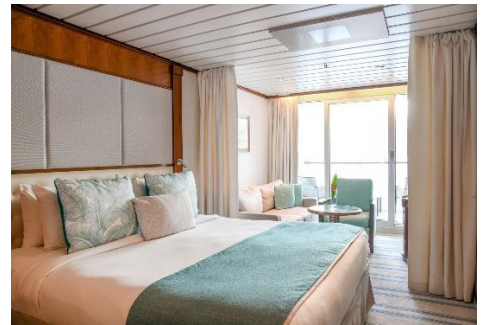
Veranda-Kabine der Kategorie B