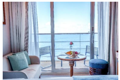
Balkon in der Balcony Kabine der Kategorie C