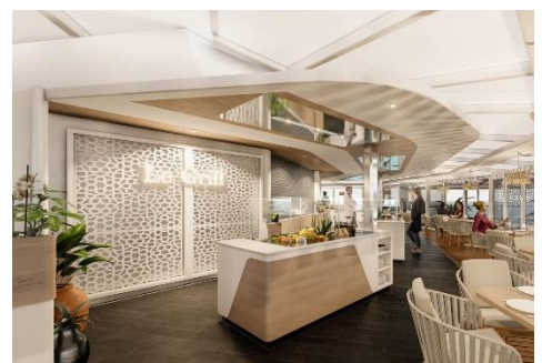
Restaurant „Le Grill“