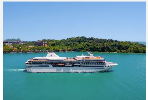
Le Paul Gauguin

Die 3 Restaurants an Bord verwöhnen Sie mit ortstypischen Spezialitäten und französischen Traditionsgerichten.