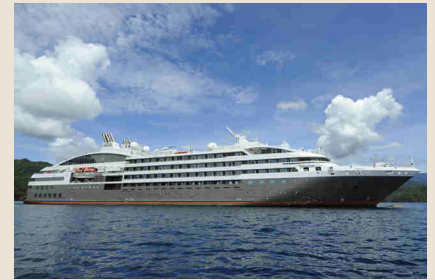
Motoryacht Le Soléal

24 Stunden Room-Service, Wifi, Ipod-Docking Station, Flachbildfernseher mit Satelliten-TV und Filmauswahl, Telefon, Minibar, individuell einstellbare Klimaanlage, Safe, Bademäntel, u. v. m. steht Ihnen hier zu Verfügung