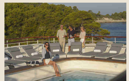
Sonnen auf dem Schiffsdeck