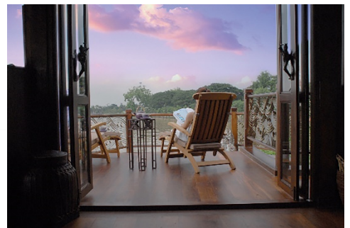
Sonnendeck im Bug des Schiffes