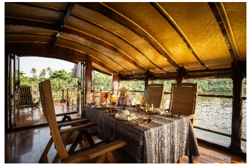
Esstisch auf dem Oberdeck