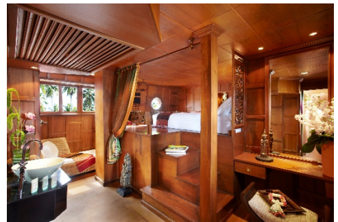
Kabine mit Kingsize-Bett