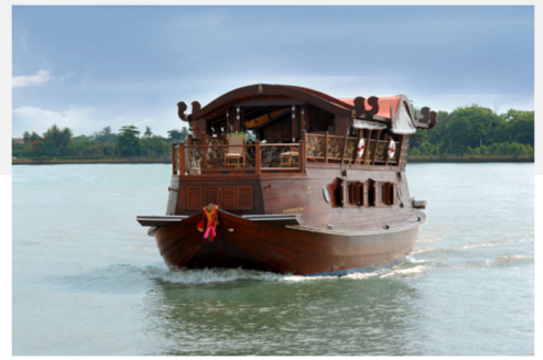
Kreuzfahrtschiff Loy Dream