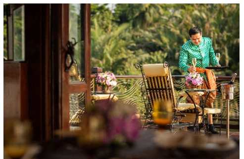
Ihr freundliches Personal