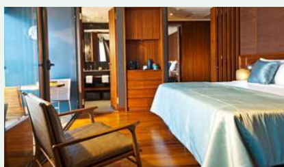
Design Suite mit Balkon