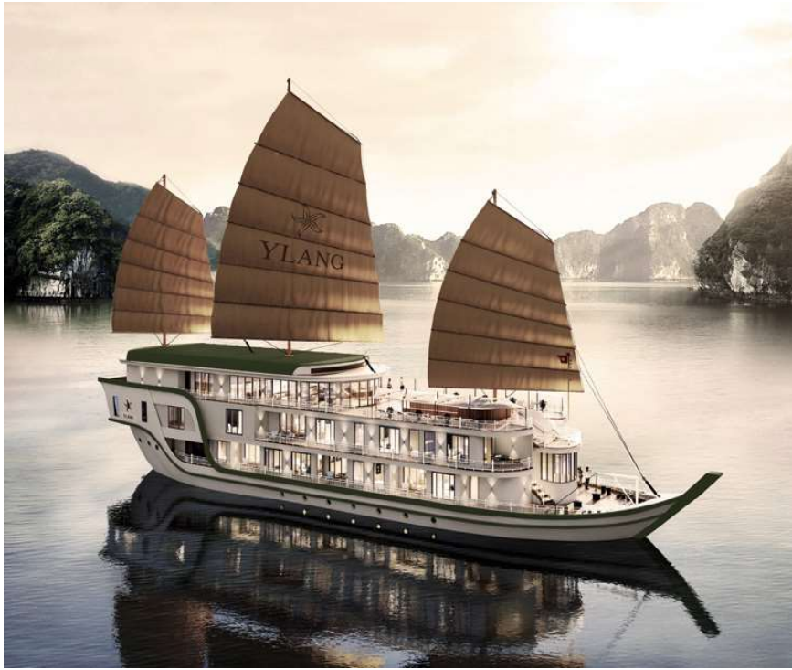
Die Ylang in der Halong-Bucht

3-tägige Kreuzfahrt in der Lan Ha-Bucht in Nordvietnam