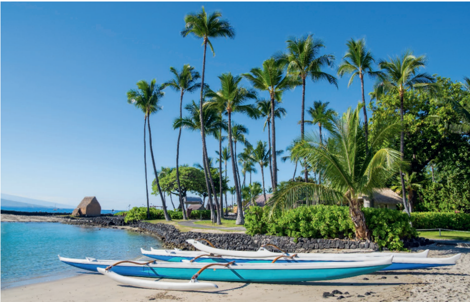
Hawaiianische Ausleger-Kanus am Kamakahonu Beach, Big Island