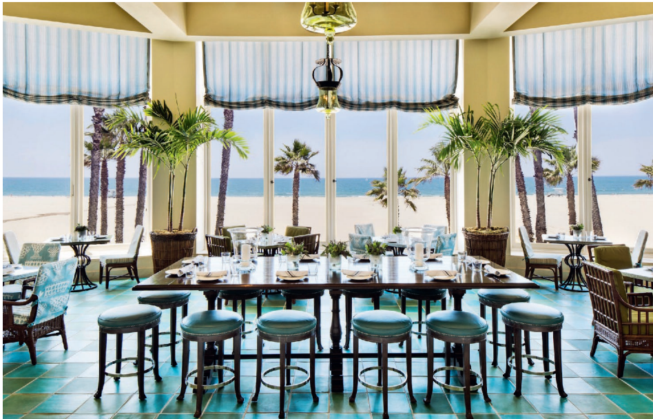
Casa del Mar, Santa Monica, Terrasse

z. B. 18-tägige luxuriöse Reise vom Glamour der „Stadt der Engel“ zu den tropischen Gefilden Hawaiis