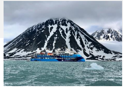
Kreuzfahrtschiff Ocean Albatros

Mahlzeiten an Bord inklusive (Vollpension), von unseren Küchenchefs zubereitet.