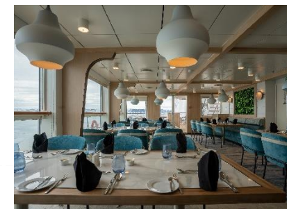
Panorama Speciality Restaurant