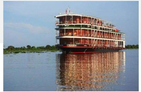
RV Bassac Pandaw