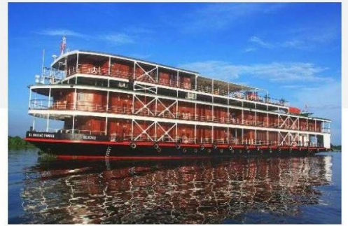
Kreuzfahrtschiff RV Bassac Pandaw