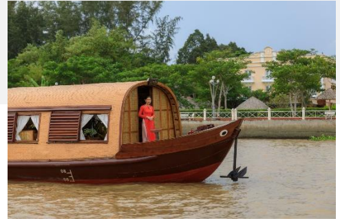
Song Xanh Sampan