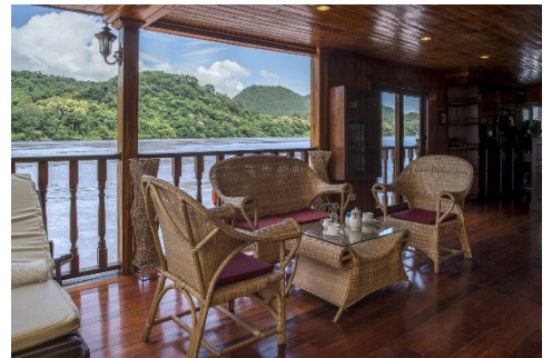
Ess- und Loungebereich