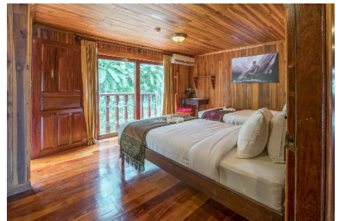
Deluxe-Kabine mit privatem Balkon