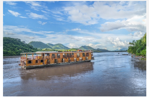
Kreuzfahrtschiff RV Mekong Pearl