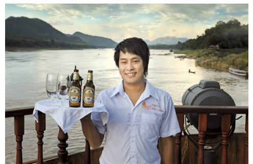
Ihr freundliches Schiffspersonal