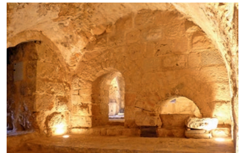
Festung Ajloun in Amman