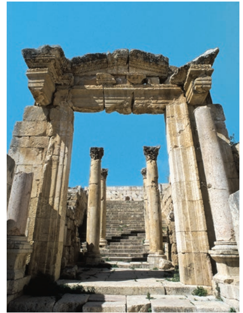
Kathedrale in Jerash

Nach dem Frühstück verlassen Sie das Tote Meer und fahren in die Hauptstadt Amman. Historisch-kulturelle Stätten wie das beeindruckende römische Theater und der Zitadellenhügel im Stadtzentrum stehen heute auf dem Programm. Sie fahren weiter zu den Wüstenschlössern aus der Zeit der Kalifen, faszinierende Zeugen für frühe islamische Kunst und Architektur. (FA)