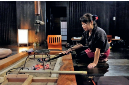
Abendessen im Kominka

das Kanamaruza, das älteste Kabuki-Theater Japans. Anschließend werden Sie zum Yoshino-Fluss gefahren, wo Sie inmitten der Oboke-Schlucht nicht nur geologische Wunderwerke, sondern auch liebevoll platzierte Figuren japanischer Dämonen und Geister (Yokai) bestaunen können. Nach diesen faszinierenden Eindrücken fahren Sie zu Ihrer Unterkunft, in welcher Sie abgeschieden von der Zivilisation die Thermalbäder des Iya-Tals genießen können. (F A)