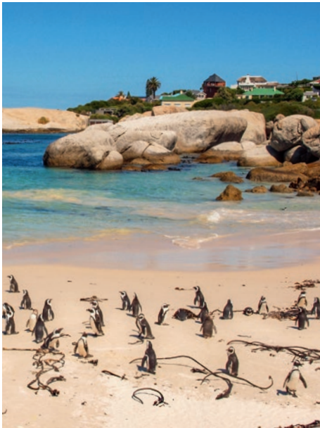
Boulders Beach, Western Cape