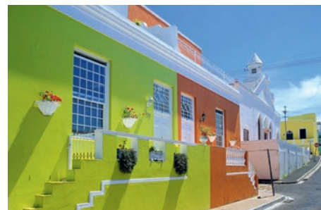
Straßenzug im Bo-Kaap, Kapstadt