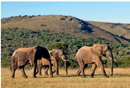
Amakhala Game Reserve