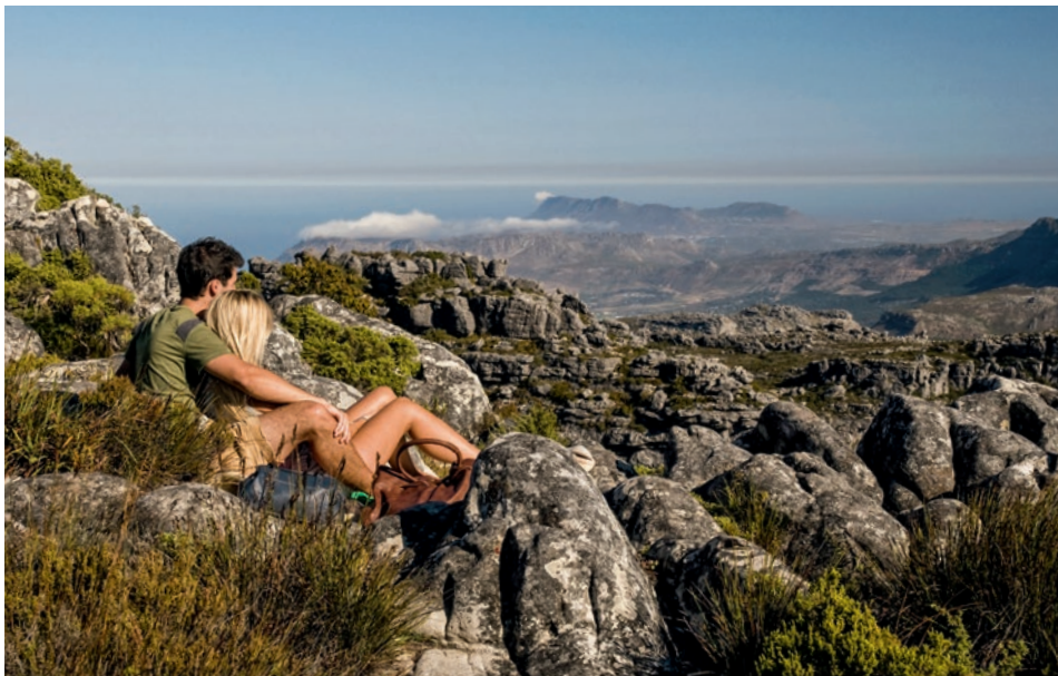
Tafelberg in Kapstadt

z. B. 12-tägige Mietwagenreise zu den Höhepunkten Südafrikas