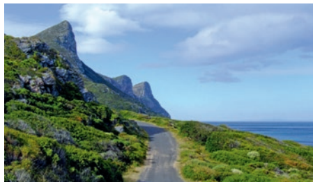
Küstenstraße am Kap der Guten Hoffnung