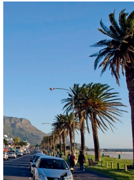
Küstenstraße in Kapstadt

Ihr heutiges Ziel ist die historische Universitätsstadt Stellenbosch. Im Umkreis von 12 km befinden sich 22 Weingüter, von denen viele im kapholländischen Stil erbaut sind. Genießen Sie eine Weinprobe in einem der umliegenden Weingüter. Empfehlenswert ist auch Franschhoek, eine Siedlung, die auch heute noch sehr stark durch die französische Kultur geprägt ist. (F)