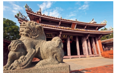
Konfuzius-Tempel in Tainan