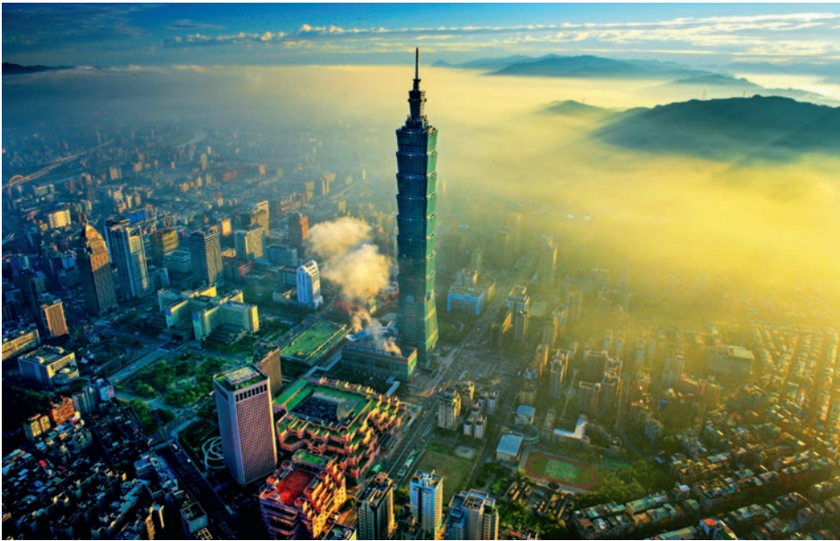
Taiwans Hauptstadt Taipei

z. B. 15-tägige luxuriöse Reise zu den Höhepunkten Taiwans