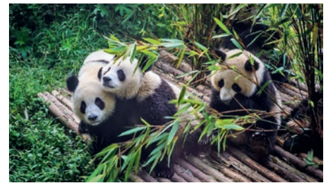
Panda-Aufzuchtstation in Chengdu