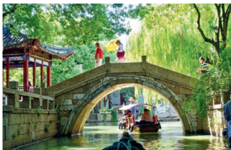
Wasserdorf Tongli, Suzhou

entlang eines steilen Felsens 12 Stockwerke in die Höhe schlängelt. (F MA)