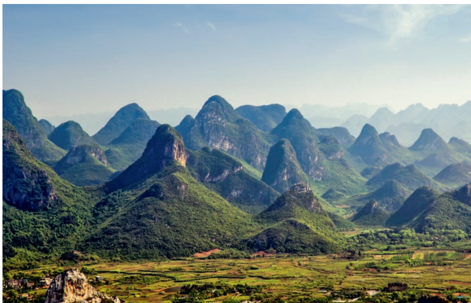
Karstlandschaft in Südchina