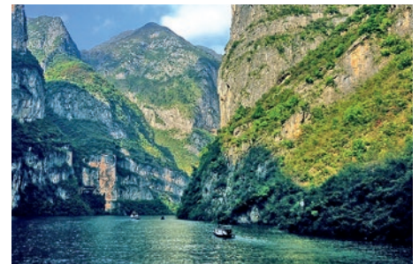
Schluchten des Yangtze

Am frühen Nachmittag erreichen Sie Chengdu, die Hauptstadt der Provinz Sichuan. Nach Ihrer Ankunft unternehmen Sie einen Spaziergang durch die historische Jinli-Straße mit ihren traditionellen Teehäusern und Geschäften. Zum Abschluss des Tages genießen Sie einen Feuertopf, die berühmte scharfe Spezialität der Sichuan-Küche. (F A)