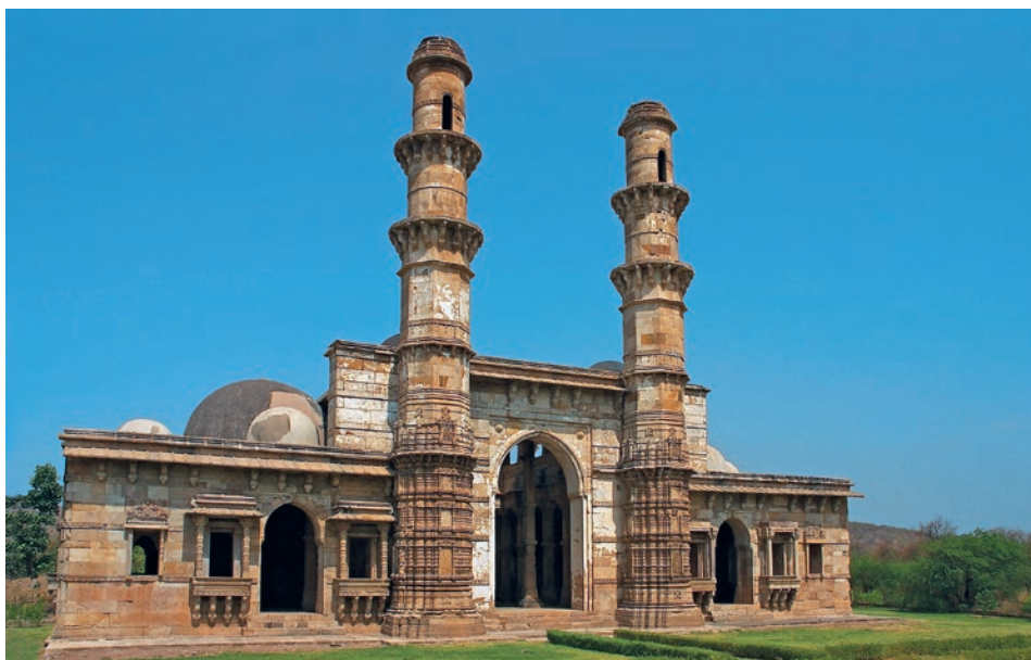
Kevada Masjid im Archäologischen Park Champaner-Pavagadh