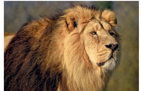
Asiatischer Löwe im Gir-Nationalpark