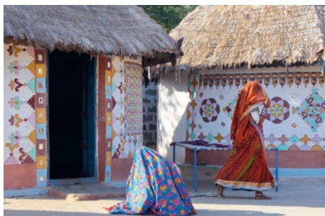
Bhungs, traditionelle Häuser nahe Bhuj

asiatischer Löwen begeistert. Mit etwas Glück begegnen Ihnen auch indische Hirsche, Nilgauantilopen (Nilgai), Chinkara (Indische Gazelle) und verschiedene Reptilien. Auch Vogelliebhaber werden auf ihre Kosten kommen. (F M A)