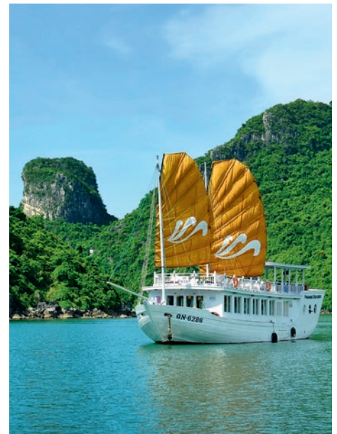
Dschunke in der Halong-Bucht

Beginnen Sie Ihren Tag mit einem Besuch der kaiserlichen Zitadelle, von wo aus die Nguyen-Dynastie zwischen 1802 und 1945 regierte. Danach steigen Sie in ein Boot und schippern auf dem