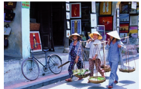
Händlerinnen in Hoi An

Parfümfluss zur Thien Mu-Pagode. Auf den Spuren der Geschichte wandeln Sie auch beim Besuch der Grabmäler der Kaiser Tu Duc und Khai Dinh. Zum Abschluss Ihrer Tour machen Sie noch einen Abstecher auf den quirligen Dong Ba-Markt. (F)