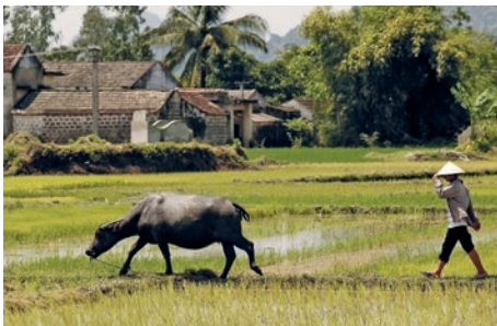
Bauer mit Büffel bei der Feldarbeit

denen Gewürze und Obst- und Gemüsesorten der vietnamesischen Küche kennen. Nach dem Einkauf geht es mit dem Fahrrad weiter zum nahegelegenen Dorf Tra Que, das für seinen ökologischen Gemüseanbau bekannt ist. Erholen Sie sich bei einem kühlen Getränk, bevor Sie die Zubereitung von Frühlingsrollen und weiteren Spezialitäten lernen. Ein gemeinsames Essen rundet den Kochkurs ab. Am Nachmittag besuchen Sie bei einem Rundgang durch die Altstadt die bekanntesten Sehenswürdigkeiten Hoi An. (F M)