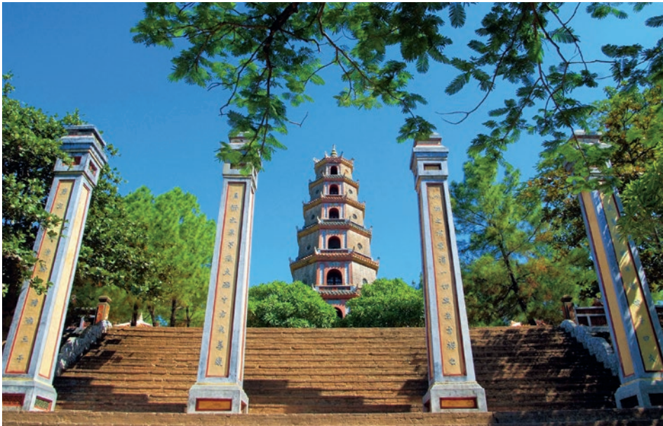
Thien Mu-Pagode in Hue