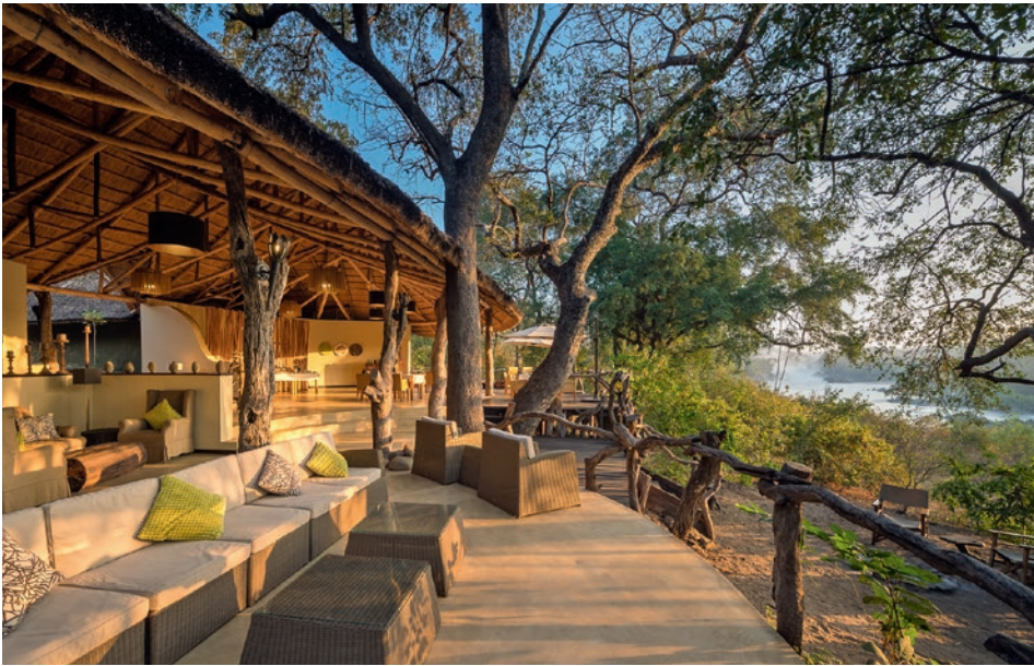
Mkulumadzi Lodge, Majete-Wildreservat, Malawi

z. B. 15-tägige, private Fly-In-Safari zum South Luangwa, Malawis Wildparks und zum Malawisee