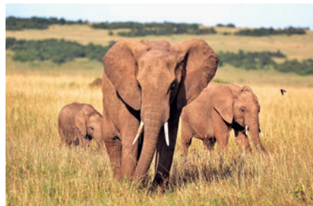
Elefanten im Majete-Reservat