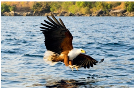
Afrikanischer Fischadler am Malawisee