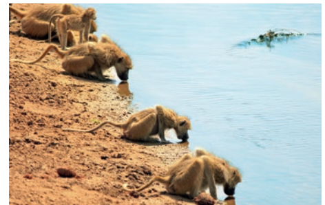
Paviane am Luangwa-Fluss

Elefanten, Zobel, Spitzmaulnashörner und Wasserböcke – litt in der Vergangenheit sehr unter Wilderei. Seit 2003 wurden erfolgreich neue Herden eingegliedert und somit ist Majete nun wieder ein Reservat voller Leben und Artenvielfalt. Von der Mkulumadzi Lodge aus stehen Ihnen unterschiedliche Ausflüge per Boot, zu Fuß oder im offenen Allradfahrzeug zur Wahl, um sich selbst ein Bild von der reichen Flora und Fauna zu machen. Ein kühler Sundowner-Drink am Pool mit Blick auf die tummelnden Flusspferde rundet den Tag ab. (F M A)