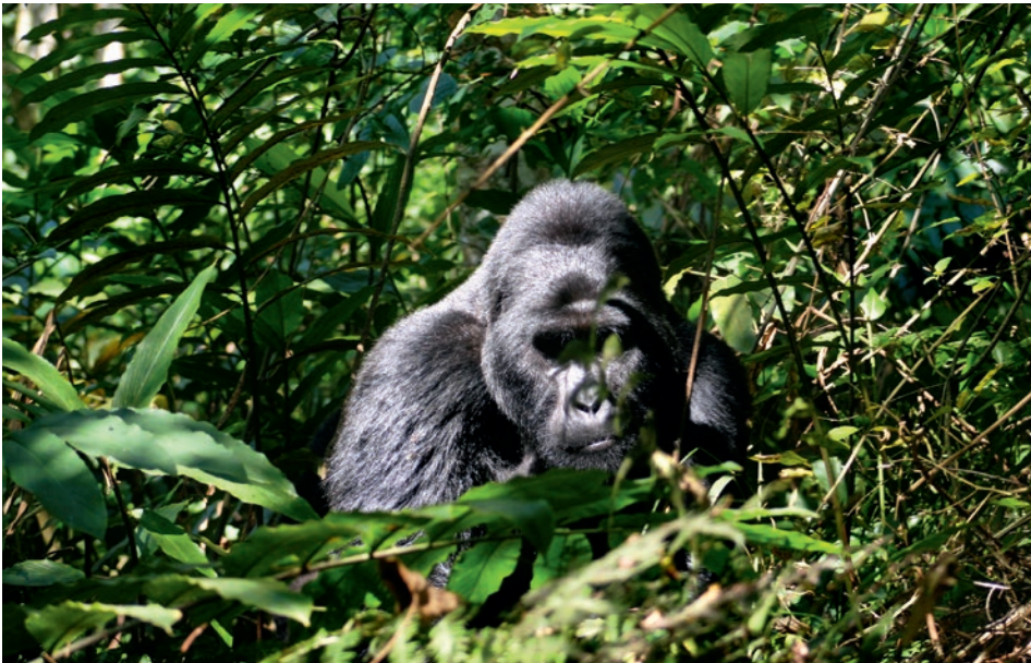
Gorilla im Bwindi Forest-Nationalpark

z. B. 13-tägige Privatreise mit Gorillabeobachtung