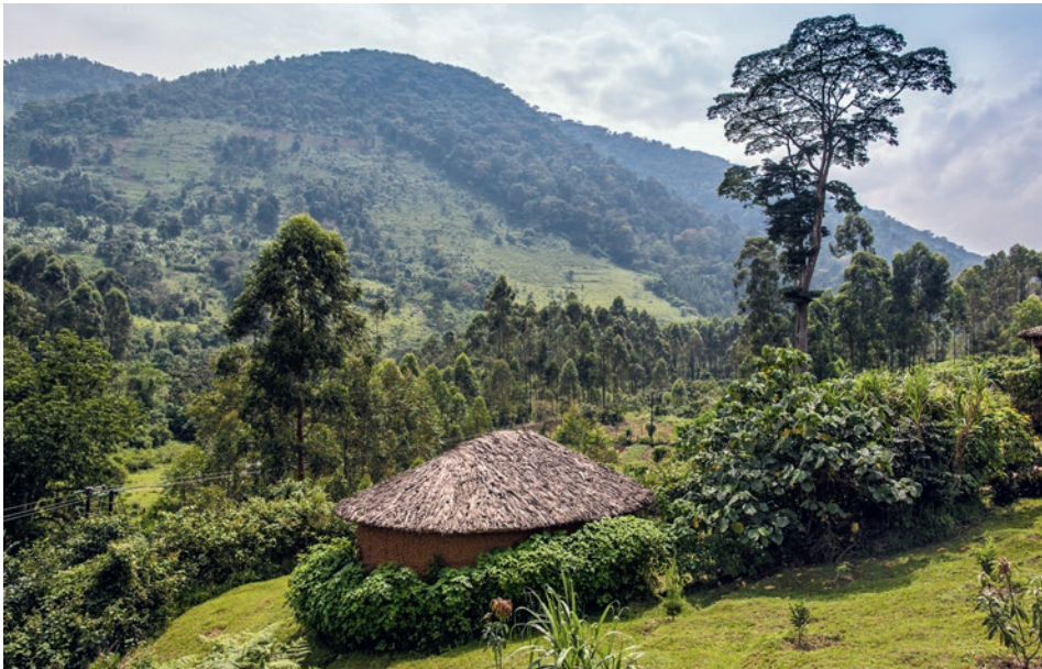
Mahogany Springs Lodge