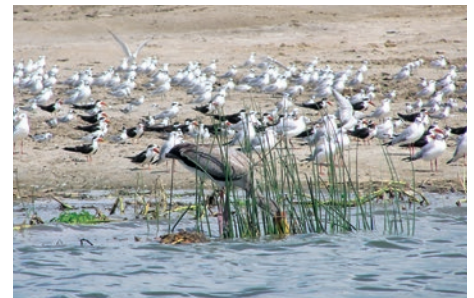
Kazinga Channel Birds im Queen Elizabeth-Nationalpark

Pirschfahrt zum Sonnenuntergang rundet den Tag ab. (F M A)