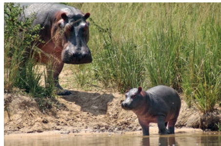
Flusspferd mit Jungem

den wohl wichtigsten Nationalpark des Landes, den Bwindi Impenetrable Forest-Nationalpark, Heimat der seltenen Berggorillas. Bwindi liegt in einer Höhe von 1.160 bis 2.600 m mit dichten Berg- und Regenwäldern. Ein Teil der Einnahmen des Parks kommt den umliegenden Dörfern zugute, so wird versucht, die Bevölkerung vom Naturschutz zu überzeugen. (F M A)