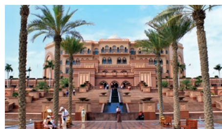
Emirates Palace Hotel