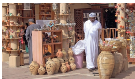
Souk in Nizwa