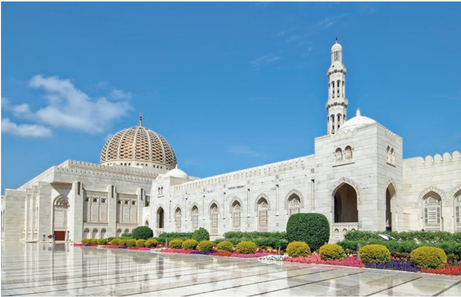
Große Moschee, Muskat

z. B. 9-tägige Privatreise mit Badeaufenthalt in Muskat