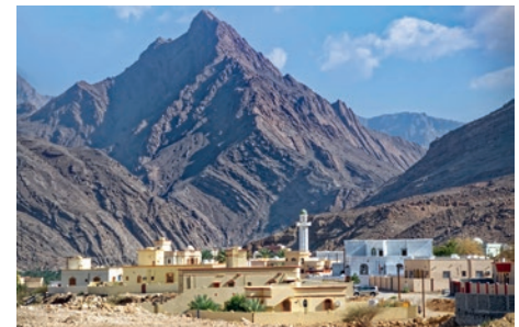
Wadi Bani Khalid