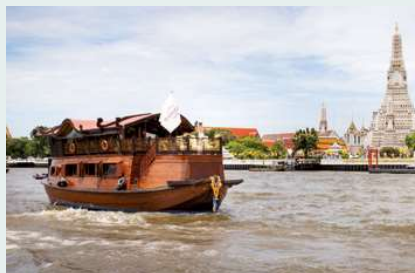
Manohra Dream, im Hintergrund Wat Arun