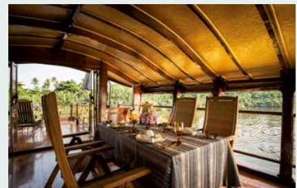
Manohra Dream, Essbereich