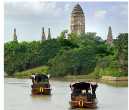
Am Ufer von Ayutthaya