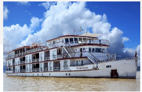
Luxusschiff Heritage Line THE JAHAN