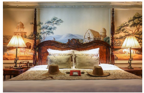
Lord Byron Noble Suite